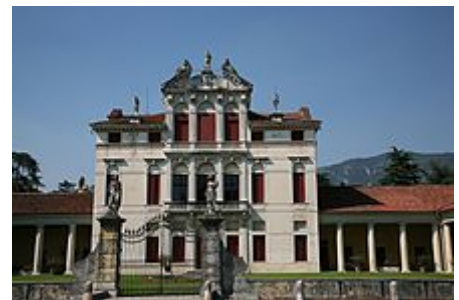
Il corpo centrale della villa, opera seicentesca di Baldassare Longhena

La villa è parte di un complesso architettonico che si distribuisce attorno a due corti rettangolari: una completamente delimitata da edifici e destinata ad uso di servizio e agricolo, mentre la seconda è edificata solo su tre lati e delimitata da un muro di recinzione. In quest'ultima vi è l'edificio padronale affiancato dalle due barchesse. In questa villa si possono trovare degli elementi che si discostano lievemente dall'estetica palladiana, ad esempio il corpo centrale si eleva su tre piani e ricorda un elegante palazzetto di gusto tipico seicentesco. Peculiare anche il timpano curvilineo spezzato che corona la villa, tipico del gusto barocco, a contrasto con le forme del retro dell'edificio che ripresentano la struttura del fronte ma in modo più dimesso. [7]