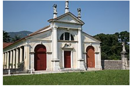
Cappella gentilizia ricavata in una delle barchesse laterali

A nord del complesso architettonico si sviluppa un ampio parco signorile di tipico gusto ottocentesco. [7] L'area della villa è circondata da una peschiera che l'abbraccia come derivante da un vecchio fossato medievale, ad oggi l'area è attraversata da un ponte che collega il giardino con un'area verde circoscritta. Vi è poi un'altra zona verde all'interno adibita a parco all'inglese con percorsi e zone di alberi. [9]