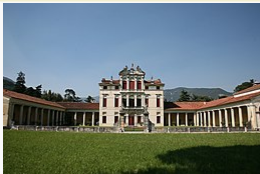
Vista frontale della villa