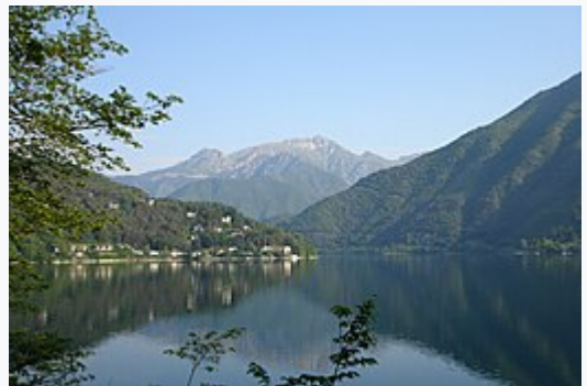
Lago di Ledro nella Valle di Ledro