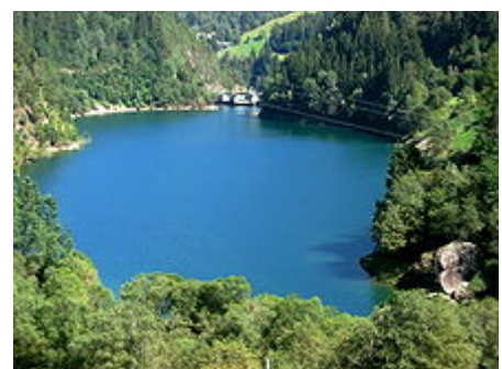
Il lago di Alborel, piccolo lago sottostante il lago di Zoccolo