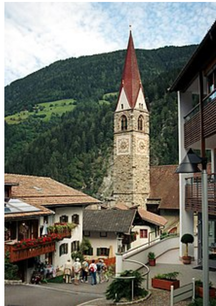
Il campanile della chiesa di San Pancrazio, la più antica della valle

Nella stagione calda la valle offre un paradiso a quanti sono amanti della natura: vi sono infatti ben 700 chilometri di sentieri di diversa difficoltà.