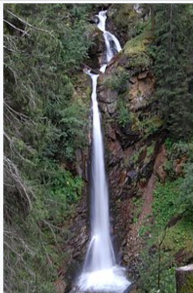
Cascata in Val di Rabbi