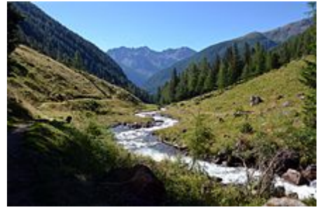
Val di Rabbi

La val di Rabbi ha conosciuto un affollato turismo d'élite, dovuto alla scoperta ed allo sfruttamento delle acque minerali. A metà '800 Rabbi era una ridente stazione di cura che accoglieva molti visitatori per stagione. Nel secolo scorso il sacerdote e scienziato Antonio Stoppani , autore de Il Bel Paese e frequentatore della località, augurava a questi luoghi un prospero futuro turistico. Era luogo di villeggiatura anche per il musicista Arturo Benedetti Michelangeli .