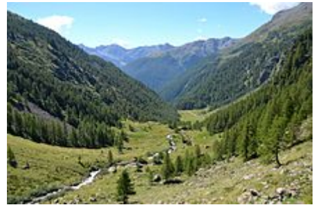
Val di Rabbi

Il rabbiese , ovvero il dialetto parlato in Val di Rabbi, appartiene alle parlate retoromanze e nello specifico esso è assimilato al ladino anaunico-solandro .