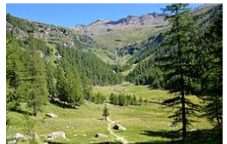
Val di Rabbi