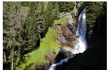
Cascata del Saent