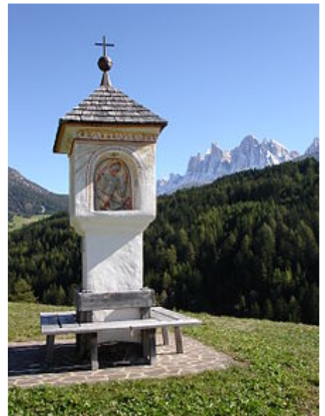
Santuario della peste