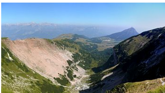
Panorama della Riserva Naturale Integrale Tre Cime del Monte Bondone