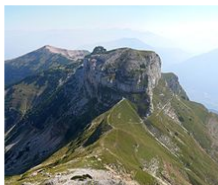
Panorama del Dos d'Abramo