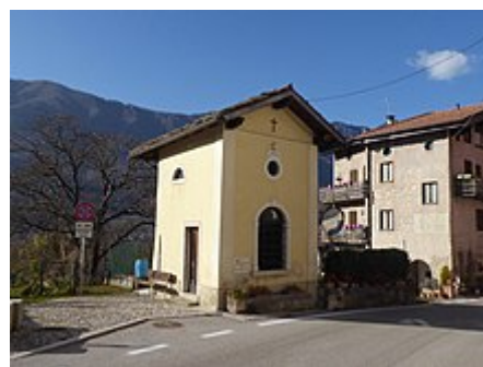
Cappella di San Rocco.