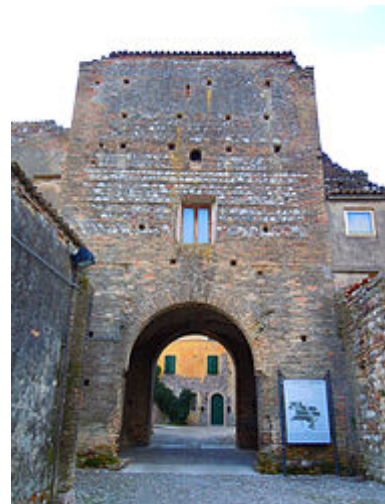
Il castello di Pozzolengo