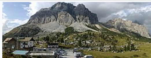
Veduta del passo di Falzarego