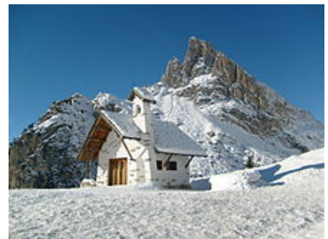
La chiesetta del Falzarego e il Sass de Stria in inverno.