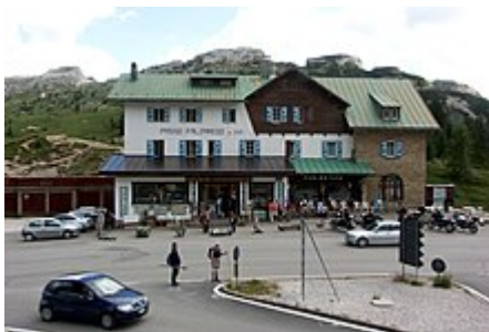
Il rifugio posto al passo

L'etimo alla base del toponimo va ricercato nel ladino ampezzano fóuze , "falce", anche se la motivazione non è chiara (forse in riferimento alla forma del luogo). [1]