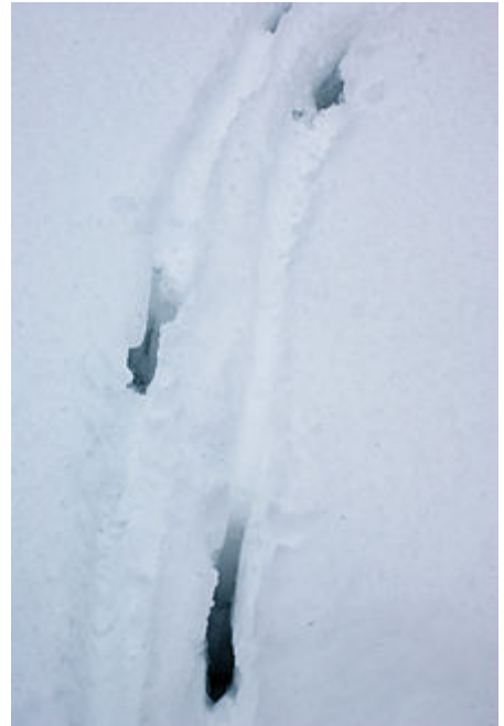
Impronte di Camoscio nella neve ctg Lessinia 2013