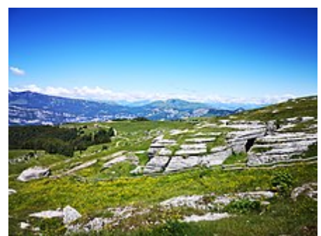
Panorama della Lessinia