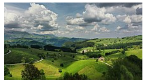
Colori della Lessinia