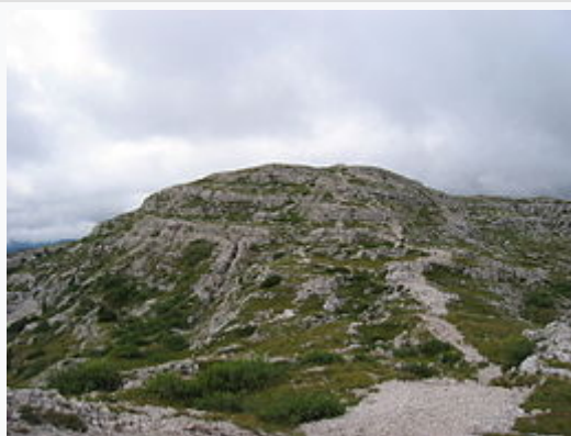
Il monte Ortigara