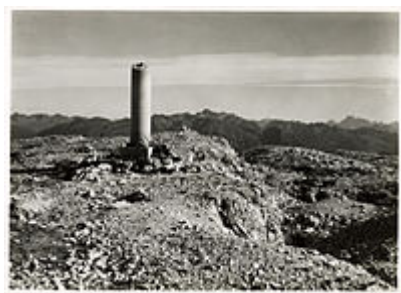
Cippo ai 20.000 caduti del Monte Ortigara.

L'Ortigara, già attaccata dai reparti italiani nel 1916 (operazione in codice "Azione K"), fu, l'anno seguente, teatro di una terribile battaglia, passata alla storia come battaglia dell'Ortigara . Tale battaglia si combatté fra il 10 e il 29 giugno 1917 nel tratto Monte Zebio - Ortigara e vide impiegati complessivamente 400.000 soldati per la conquista del settore. Numerosissimi furono i morti soprattutto sull'Ortigara; sul passo dell'Agnella, via obbligata per raggiungere la cima da parte delle truppe italiane, si trovava un tempo uno dei 41 Cimiteri di guerra dell'Altopiano dei Sette Comuni . Gli italiani schierarono 22 battaglioni alpini , 4 reggimenti di fanteria (12 battaglioni) e 1 reggimento bersaglieri (3 battaglioni) nel tentativo della conquista dell'Ortigara, occupata dalla prima linea austroungarica: gli imperiali riuscirono, con le operazioni in codice "Wildbach" ed "Anna", a bloccare ogni tentativo di penetrazione nemico, che costò ai reparti italiani enormi perdite. Il