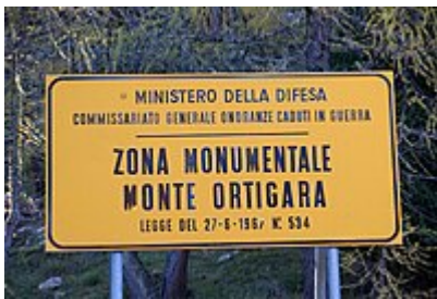
Cartello nei pressi del Piazzale Lozze