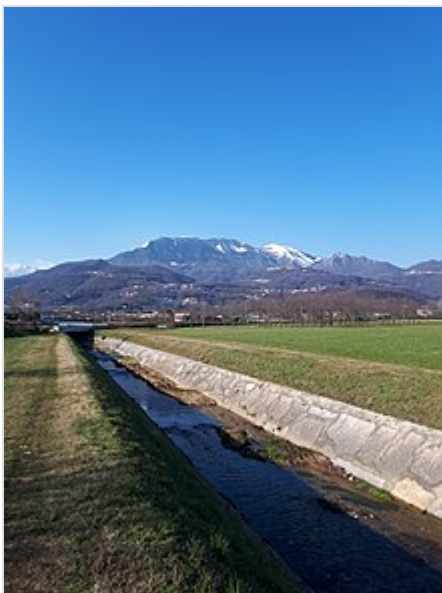
Il monte Novegno ripreso da Schio

Questa voce o sezione sugli argomenti montagne d'Italia e Vicenza non cita le fonti necessarie o quelle presenti sono insufficienti.