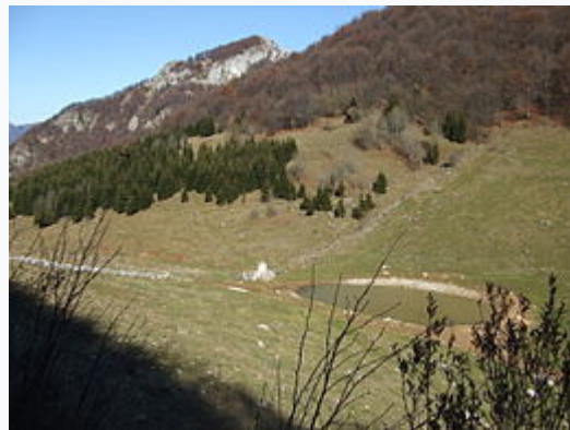
Novegno, passo di Campedello e monte Priaforà