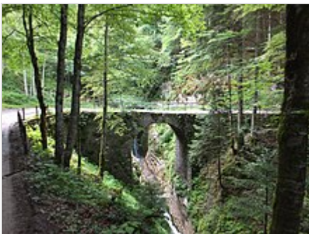
L'antico ponte sul Massangla in località Croina

Tra i suoi affluenti di destra vi sono il rio Sache, il rio (o Assat) di Santa Lucia e l'Assat di Pur; tra quelli di sinistra, il rio della Val dei Molini, l'Assat di Concei (che passa in mezzo a Bezzecca) e il rio di Pieve [3][4] ; a valle di Tiaro di Sotto il torrente forma la cascata del "Gorg d'Abiss" [5] .