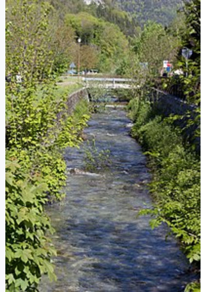
Il torrente Massangla a Pieve di Ledro