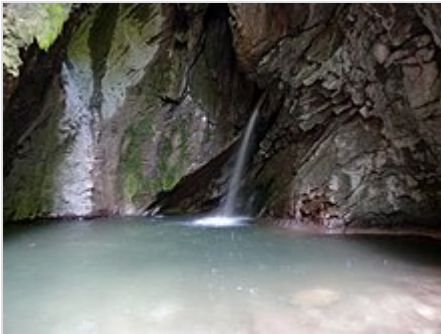
La cascata del "Gorg d'Abiss"

Il Massangla è un torrente della val di Ledro, in Trentino; nasce dal Monte Nozzolo, percorre la Val di Croina e sfocia nel Lago di Ledro presso Pieve (dove è chiamato anche "Assat di Pieve") [1][2][3] .