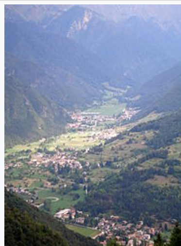
Gli abitati della Val di Concei e Pieve di Ledro