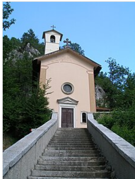
Santuario della Madonna Addolorata, nella frazione di Barcesino .