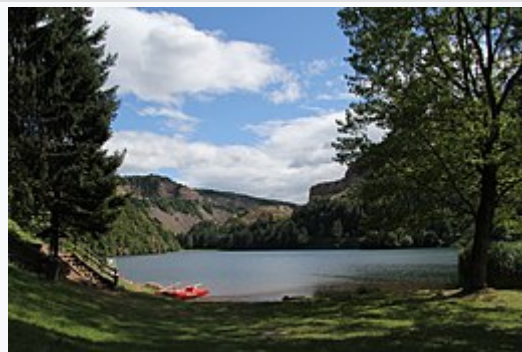
Il lago visto dalla spiaggia sulla sponda settentrionale