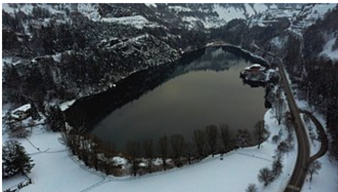
Vista aerea invernale del lago

Il lago si trova in una ripida vallata, circondato da alture ormai sviscerate per le quotidiane perforazioni causate dall' estrazione del porfido . Infatti gli scavi hanno portato a formare enormi squarci e quindi grandi discariche che tra San Mauro e il Gorsa incombono sulla strada Provinciale e minacciano di "strozzare" il lago di Lases, come il Lago di Valle (piccolo lago di origine vulcanica).