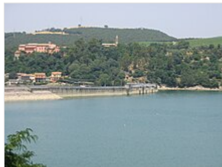
Lago di Corbara - La diga