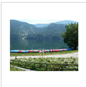
Pedalò sulla spiaggia.