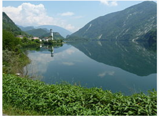
La frazione Rocca sulla sponda occidentale