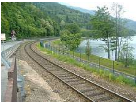
Pista ciclabile che corre fra il binario e il lago

Il lago si trova nella Comunità Alta Valsugana e Bersntol e sulle sue sponde si sviluppano i comuni di Caldonazzo , Calceranica al Lago , Pergine Valsugana e Tenna .