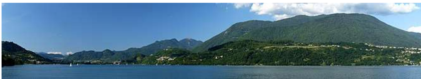
Panorama del lago di Caldonazzo dalla Ciclopista della Valsugana presso la Stazione di Calceranica