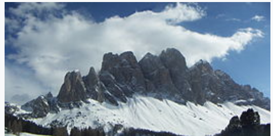
La catena delle Odle di Funes