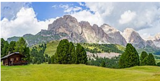
Il gruppo delle Odle visto da sud.

Le Odle si compongono principalmente di due catene, le Odle di Eores [1] e le "Odle di Funes":