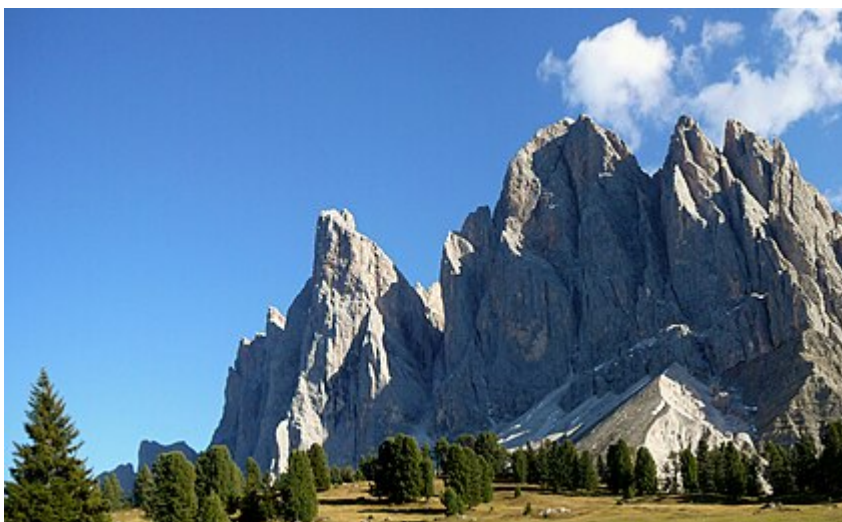
Vista del gruppo delle Odle. Versante nord dal Rifugio delle Odle .