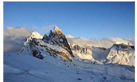
Le Odle viste dal Seceda .