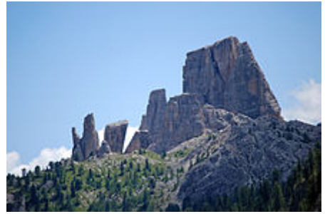
Le Cinque Torri .