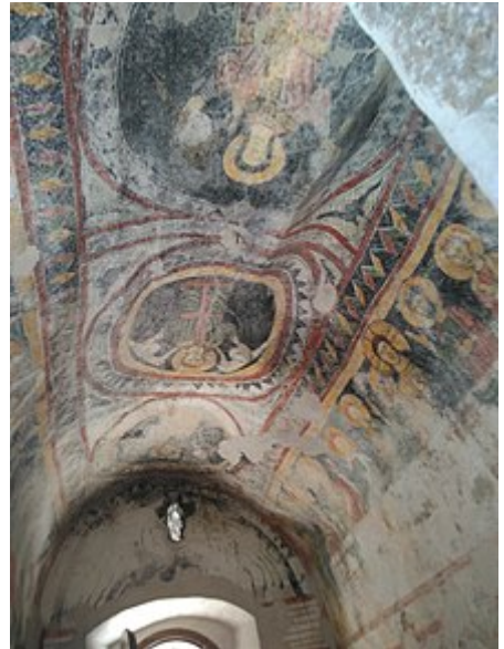
Affreschi del soffitto e parte dell'Ultima cena

Nell'interno sono conservati gli affreschi che raffigurano l' Ultima cena e le Storie della vita di San Paolo dipinte direttamente sulla parte rocciose dell'aula dall'artista locale noto come maestro di Ceniga . [4] La sala è semplice, con copertura a botte. Nella piccola chiesa viene officiata la Messa solo due volte all'anno. [1]