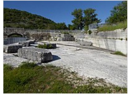
Cave di Pila