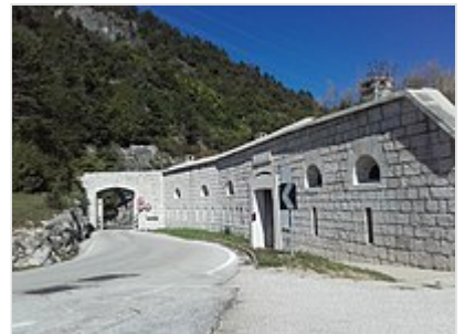
Forte di Civezzano