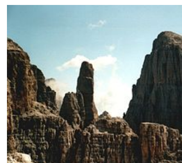
Il Campanile Basso (al centro) e la cima Brenta Alta (a destra)