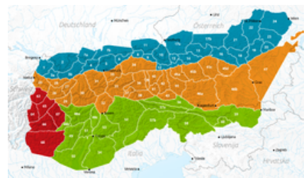
Le Dolomiti di Brenta secondo l'AVE sono individuate dal numero 51