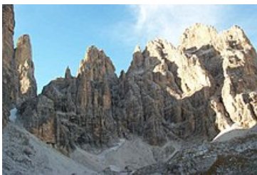
Il Campanile Basso e la Catena degli Sfulmini

Da più di un secolo sono diventate una meta per alpinisti ed escursionisti che giungono da tutto il mondo, offre una straordinaria varietà di ascensioni, percorsi attrezzati e sentieri, oltre a decine di rifugi e bivacchi in quota.