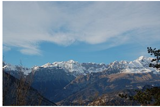
Dolomiti di Brenta dalla Valle dei Laghi (Trentino)