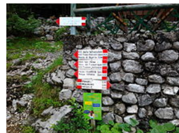
Indicazione per i vari rifugi, presso il rifugio Croz dell'Altissimo