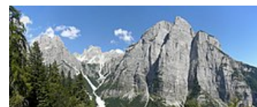
Vista del Croz dell'Altissimo e di altre cime dolomitiche