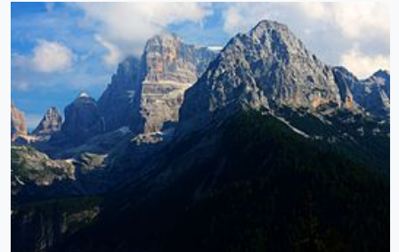
Alcune delle vette delle Dolomiti di Brenta