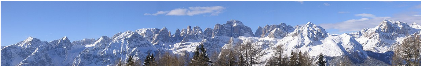
Panoramica invernale sul Gruppo delle Dolomiti di Brenta dalla Paganella