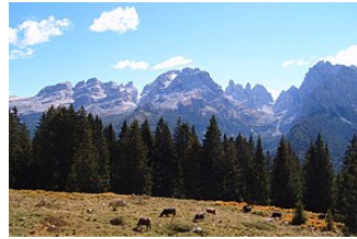
Dolomiti di Brenta da ovest