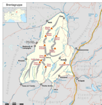
Cartina dettagliata del gruppo montuoso.