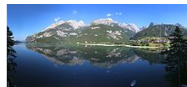
Lago di Molveno