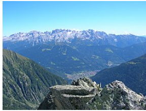
Dolomiti di Brenta da ovest