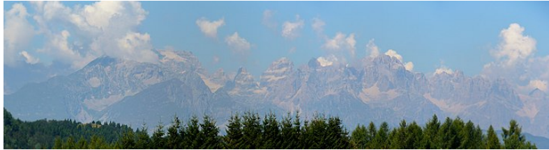
Il gruppo del Brenta dal Monte Bondone