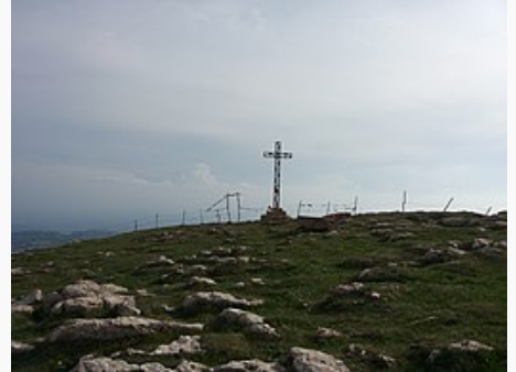
Cima del Corno d'Aquilio