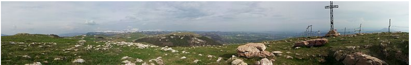
Panorama nei pressi del Corno d'Aquilio