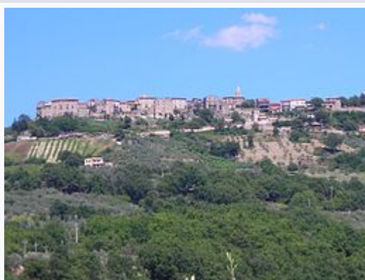
Una veduta panoramica di Civitella del Lago