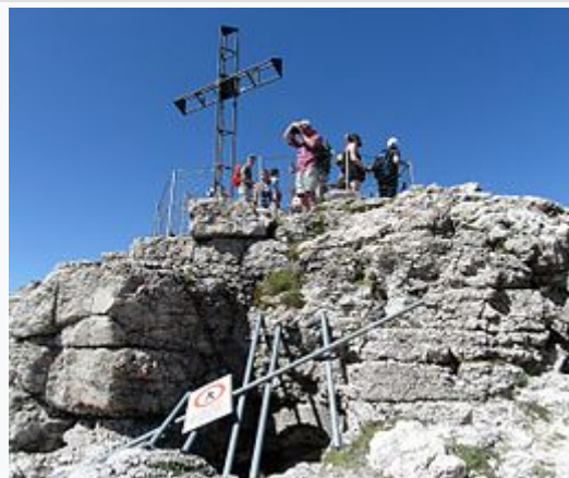
Croce e rovine del forte Vezzena collocato in vetta alla montagna.