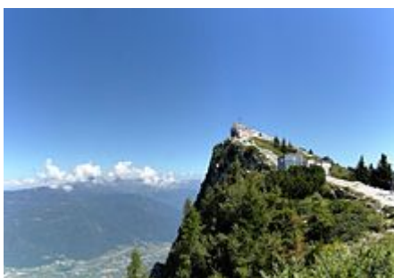
La cima Vezzena con i resti del forte Vezzena durante lavori di valorizzazione

La montagna si eleva a nord rispetto alla Piana di Vezzena . Sulla vetta si trovano i resti dell'ex forte Vezzena , parzialmente restaurato nel 2016, con la sistemazione di una recinzione per impedire l'accesso alla parte interna della struttura.