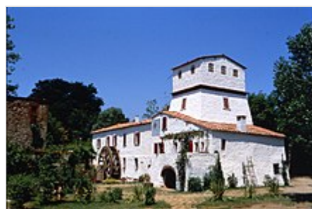
Il mulino di Chiusdino restaurato per gli spot de "La Famiglia del Mulino"

Sito istituzionale ( http://www.comune.chiusdino.siena.it )