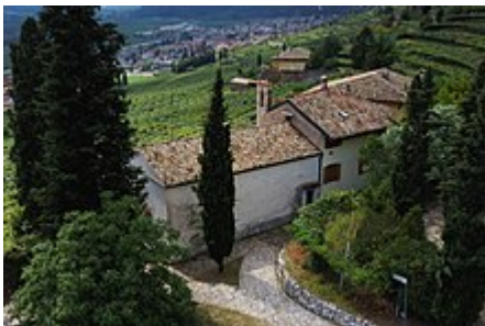
Vista aerea laterale

La nobile famiglia Castelbarco fece costruire una prima chiesa a Sabbionara di Avio tra il 1319 ed il 1322. Tale edificio in origine venne orientato verso sud, ed era dotato di un'abside di piccole dimensioni. Dopo la sua erezione gli interni vennero decorati. [1]