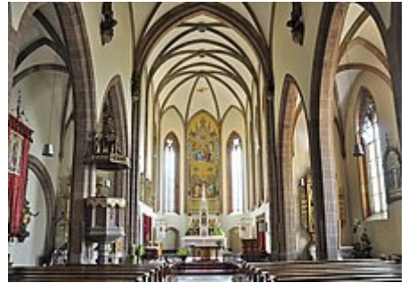
Navata centrale della chiesa.