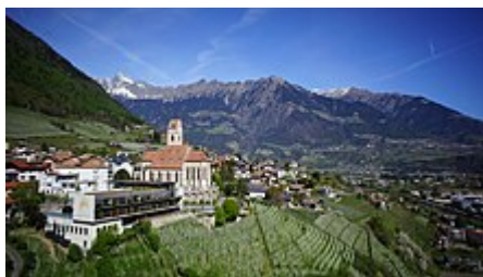
Panorama di Marlengo con la chiesa di Santa Maria Assunta.

La prima volta che il luogo di culto di Marlengo viene ricordato si trova in documentazioni storiche risalenti al 1166. Attorno alla metà del XIII secolo l'edificio originario fu oggetto di un'importante ristrutturazione e nuovi lavori, che comportarono anche un suo ampliamento, vennero realizzati oltre due secoli più tardi, attorno al 1480. In quest'ultima occasione fu edificata la torre campanaria, che non ci è pervenuta perché successivamente andata distrutta con un incendio. [2][3]