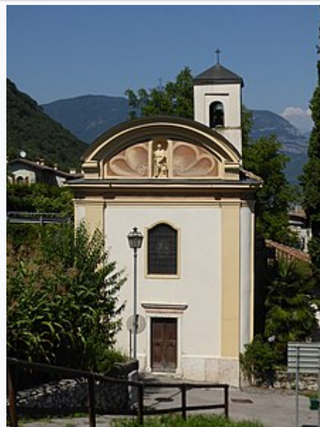
Facciata della chiesa