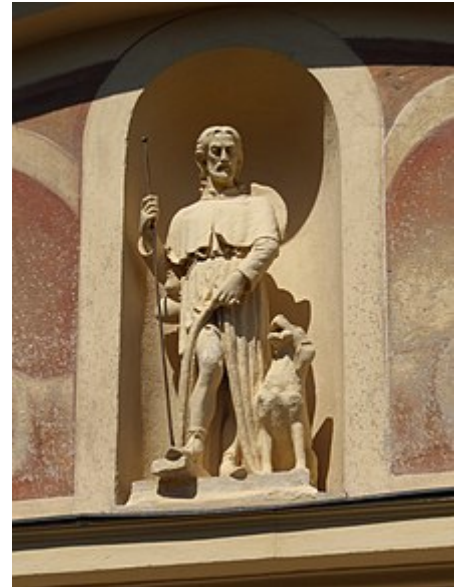
Statua che raffigura San Rocco sulla facciata

Nel secondo dopoguerra del XX secolo , durante gli anni quaranta e nel decennio successivo, vennero realizzati restauri a fini conservativi. Nelle fasi finali dei lavori furono trovate, oltre alla pergamena già citata, anche alcune reliquie conservate nell'altar maggiore. I restauri comportarono, oltre ad altri interventi, il rifacimento di parte delle vetrate ed un nuovo ciclo di arricchimenti decorativi che riguardarono le pareti interne e le volte sia della navata sia del presbiterio. [1]