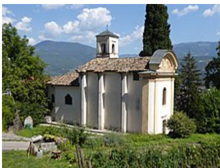
Chiesa di San Rocco, facciata e fianco laterale sinistro

L'edificio venne eretto quasi certamente durante la prima metà del XV secolo poiché nel 1537, dagli atti relativi alla visita pastorale del cardinale e principe vescovo di Trento Bernardo Clesio , risultò la presenza di tale luogo di culto. La consacrazione fu celebrata il 6 maggio del 1562, e questo si desume da una pergamena che venne rinvenuta in una bottiglia che si trovava all'interno del demolito altare maggiore durante i restauri realizzati nel 1954. [1][2]