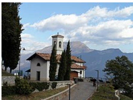
Immagine d'insieme della chiesa

Un primo riferimento storico alla piccola chiesa è del 1633, e poiché nel documento si citano lavori da eseguire al suo interno, cioè la cancellazione di alcuni affreschi, era presente sul sito già in precedenza, come sussidiaria alla pieve di Ledro .