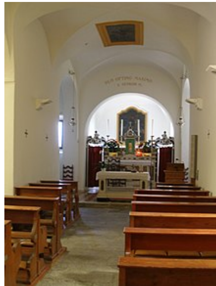
Interno con zona presbiteriale dopo l' adeguamento liturgico