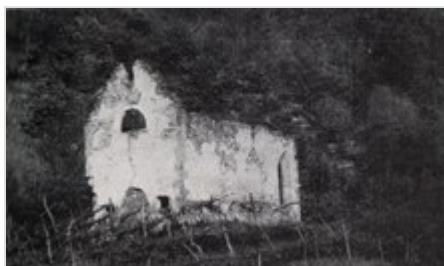
La chiesa in rovina, in una foto antecedente al 1970