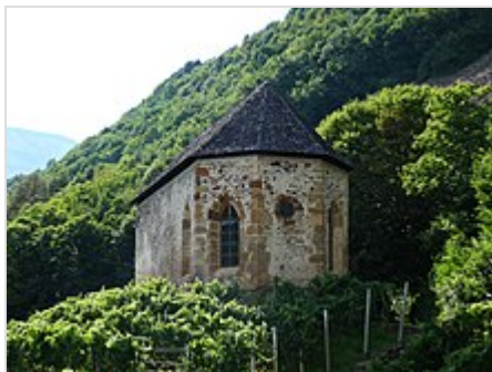
Vista del retro