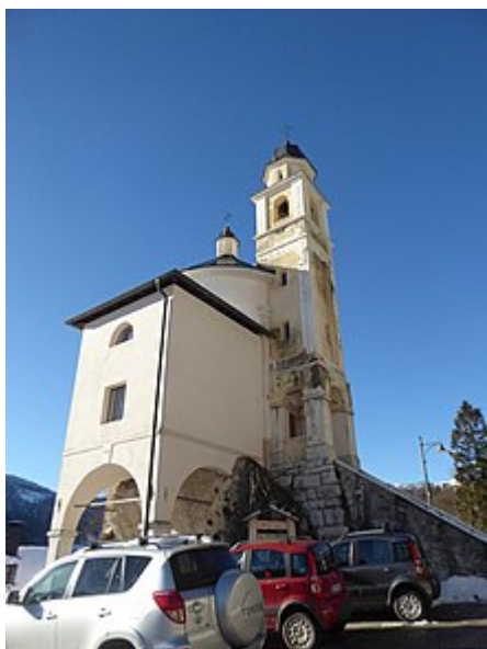
Vista da sud