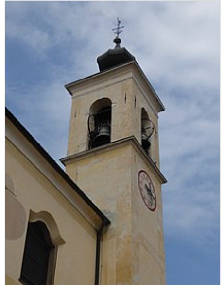
Particolare della torre campanaria.

L'orientamento dell'edificio, che si trova nel centro dell'abitato di Villamontagna, è tradizionalmente verso est. La facciata a capanna si affaccia su una strada in leggera pendenza ed è a due spioventi. Presenta gli spigoli arrotondati e risulta suddivisa da fasce orizzontali dipinte che scandiscono anche il frontone triangolare superiore. Il portale di accesso è architrovato e vi si accede da alcuni gradini. La torre campanaria è posta in posizione arretrata, sulla destra della struttura, accanto alla sagrestia . [1]