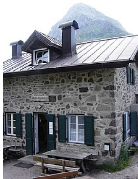
Rifugio alpino laghi di Colbricon