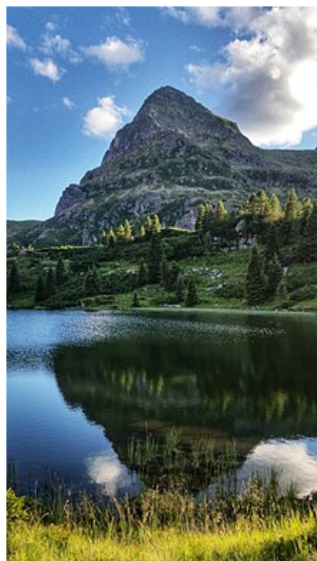
La maestosa piramide del Colbricon che si specchia sugli omonimi laghi