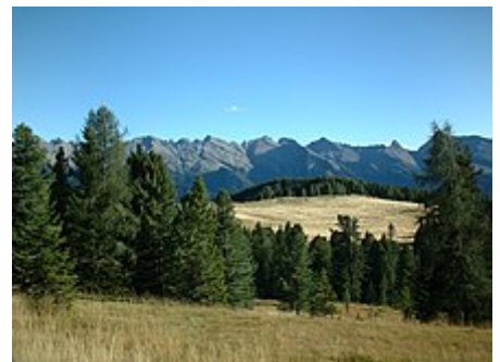
La catena del Lagorai vista da passo Lusia