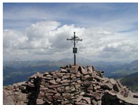
La cima Cece

Secondo la SOIUSA e ruotando in senso orario, i limiti geografici sono: passo Rolle , torrente Cismon , torrente Vanoi , passo Cinque Croci , val Campelle , val Calamento , passo di Fiemme , val Cadino , val di Fiemme , torrente Travignolo , passo Rolle .