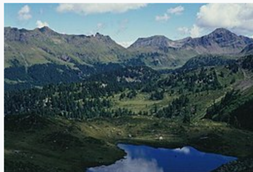
Catena del Lagorai