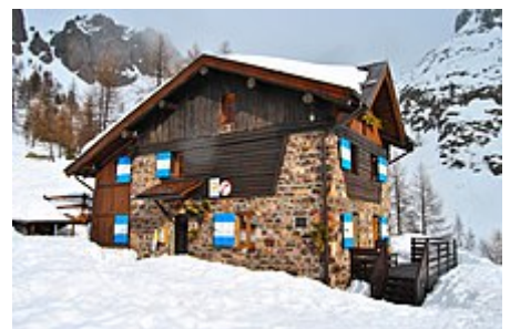
Il rifugio Sette Selle