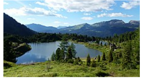
Laghi di Colbricon