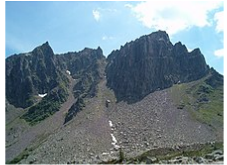
Il monte Cauriol

La sua collocazione geografica è marginale se non esterna al territorio dolomitico tradizionalmente identificato. In questo senso, quindi, il termine Lagorai indica una vasta area del Trentino orientale occupata dall'omonima catena montuosa formata in maggior parte da rocce porfiriche appartenenti alle Vulcaniti Atesine , ma anche dalle rocce metamorfiche (filladi, scisti, gneiss