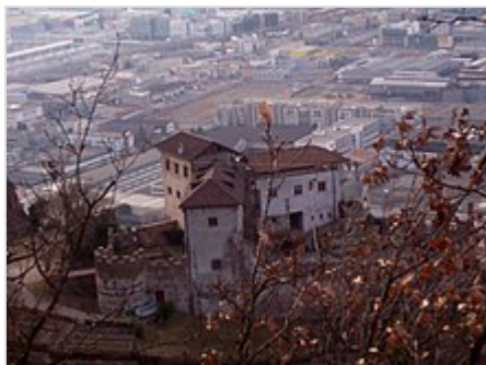
Castel Flavon da uno dei sentieri che lo sovrastano

Sorto probabilmente sui resti di un castelliere retico , risale ai primi anni del XIII secolo . Primi proprietari furono i signori di Haselberg, originari appunto di Haslach (Aslago); questi, nel 1259, vendettero i loro diritti giurisdizionali sul distretto parrocchiale di Bolzano al conte Mainardo II di Tirolo-Gorizia [2] . Il castello passò poi di mano in mano, fino a che - tra il 1475 e il 1541 - i signori di Fiè (i Völs ) non lo modificarono profondamente: è