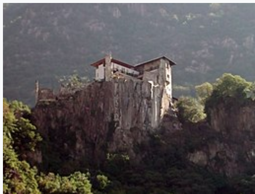
Castel Flavon da Bolzano