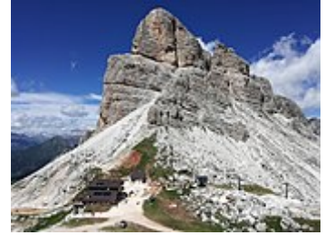
Forcella Nuvolau con il Rifugio Averau