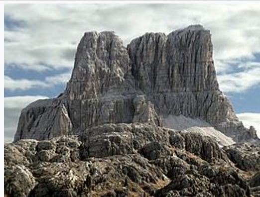
Averau (m 2648)