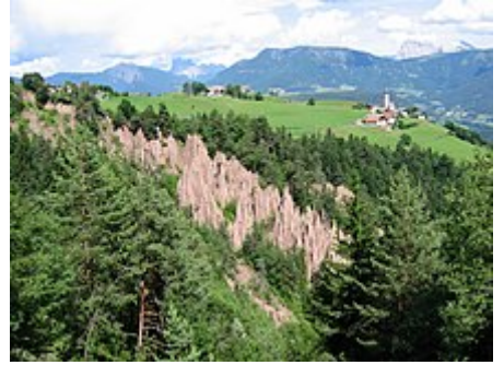
Piramidi di roccia del Renon

Estratto da " https://it.wikipedia.org/w/index.php?title=Altopiano_del_Renon&oldid=133001109 "