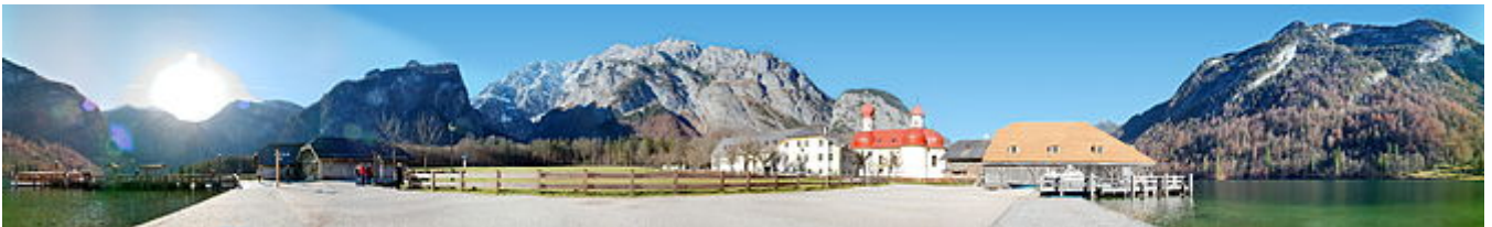
Veduta panoramica della penisola di Hirschau con il complesso della cappella di San Bartolomeo, il casino di caccia ed il porticciolo