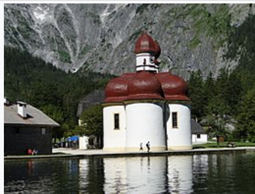
La cappella di San Bartolomeo sul Koenigssee da un battello