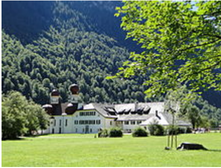
Complesso edificato comprendente la cappella di San Bartolomeo e il casino di caccia

La penisola può essere raggiunta agevolmente solo attraverso la navigazione sul lago; il percorso via terra è molto lungo ed accidentato e implica un cammino faticoso sulla zona alpina. La cappella, nella sua ultima versione, è in stile barocco. Essa ha una pianta che, nel suo piccolo, rimanda alla cattedrale di Strasburgo . Il coro è a tre conche,