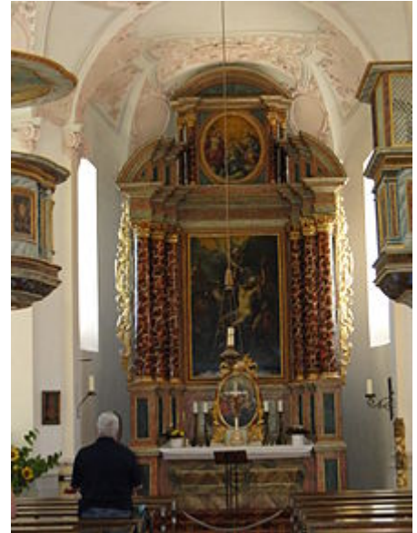
Altare maggiore della cappella di San Bartolomeo sull'omonima penisola del Koenigssee

La penisola può essere raggiunta agevolmente solo attraverso la navigazione sul lago; il percorso via terra è molto lungo ed accidentato e implica un cammino faticoso sulla zona alpina. La cappella, nella sua ultima versione, è in stile barocco. Essa ha una pianta che, nel suo piccolo, rimanda alla cattedrale di Strasburgo . Il coro è a tre conche,