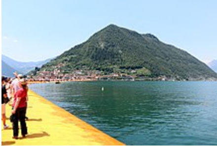
The Floating Piers a Monte Isola

In precedenza, l'isola era conosciuta in Italia come uno dei maggiori produttori di reti da pesca; ma questo settore ora è cessato. Oggi, la maggior parte della popolazione dei paesi dell'isola lavora nelle città sulla terraferma; ma è ancora attiva la pesca sull'isola e in molti posti si vede il pesce essiccato al sole.